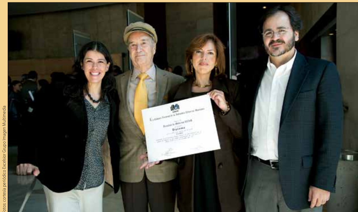
Nayeli Zaragoza Ibarra, diseño, maquetación y corrección de estilo; Rafael Álvarez Cordero, editor; Rocío Sibaja Pastrana, asistente editorial; Pedro María León Olea, cuidado de la edición.

lectores un material de calidad han rendido frutos, y que vamos por buen rumbo aunque no tenemos todo el camino andado, que el esfuerzo debe ser constante y cada vez mayor, y que ahora no nos podemos echar a dormir.